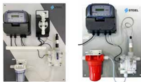
Control de cloro y dióxido de cloro, en agua fría o caliente

Usted puede también solicitar cambios adaptados a las necesidades de aplicaciones específicas.